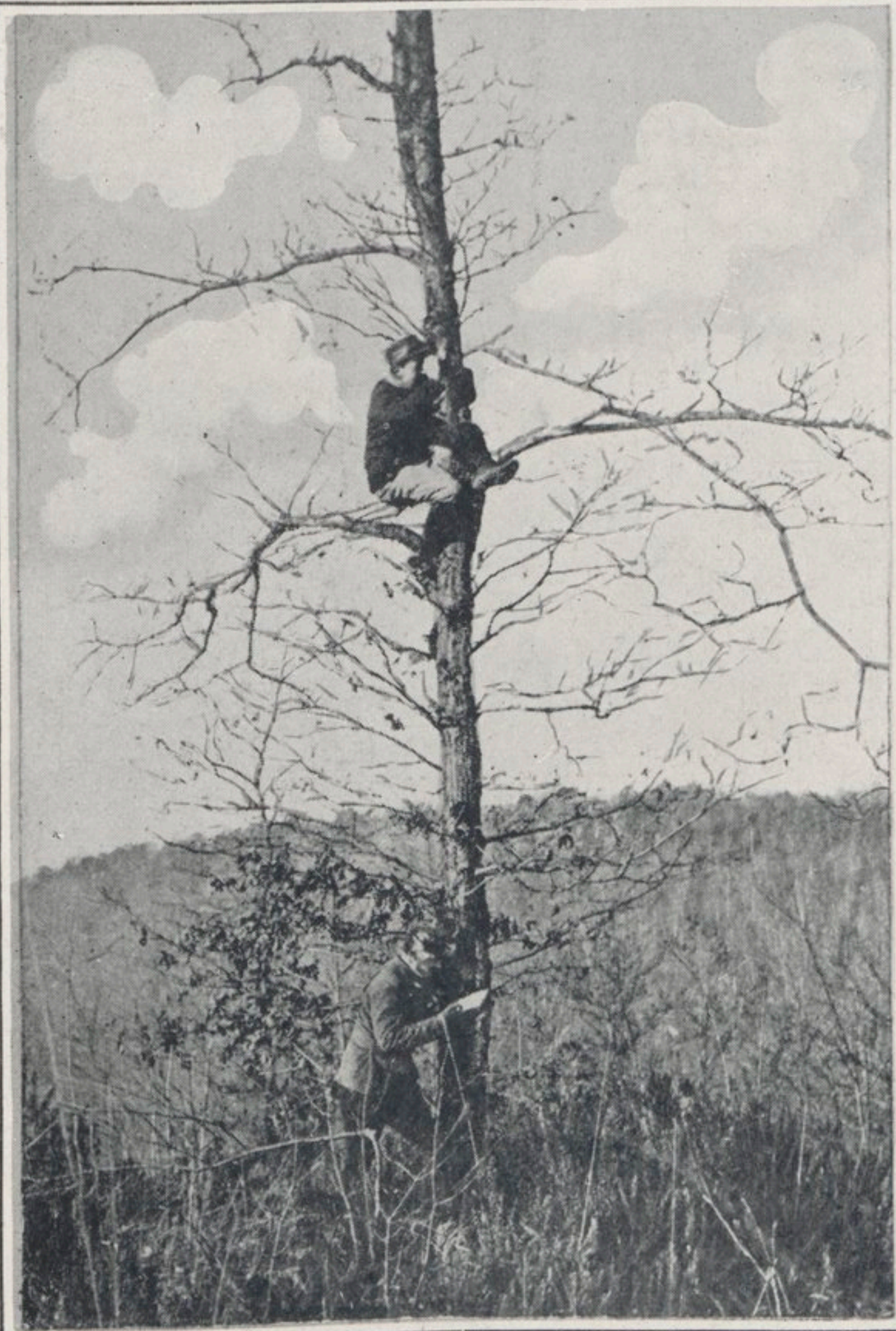
Un poste d'observation (bois de Vauquois).

PRÈS DE VAUQUOIS. — Le village est construit sur un éperon d'où il domine de 130 mètres la vallée. L'on voit ici l'un des chemins creux, gardé par un petit poste, qui y mènent.